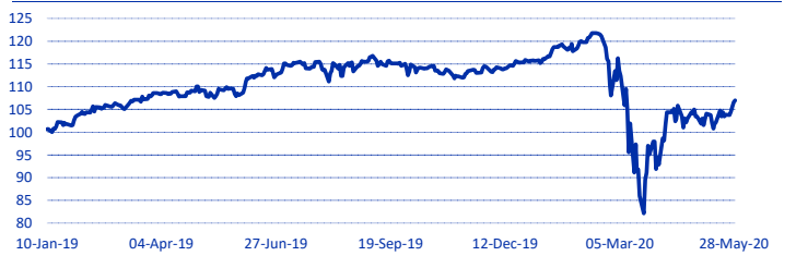
Gráfico de rendimiento

El objetivo de inversión del Subfondo es generar crecimiento de capital del mercado de valores, mientras mantiene en conjunto, una menor volatilidad en comparación con el mercado de valores más amplio de EE.UU. Se espera que el Subfondo invierta principalmente en el mercado de renta variable de EE.UU., centrándose en las acciones cotizadas por emisores domiciliados o cuyo país de riesgo sea los Estados Unidos de América. En conjunto, el Fondo buscará que estas inversiones tengan características de volatilidad más bajas en relación con el amplio mercado estadounidense de valores. Hasta el 100% de los activos del Subfondo pueden invertirse en acciones. Sin embargo, no se espera que el Subfondo tenga una industria específica, una capitalización bursátil o una tendencia al sector del mercado.